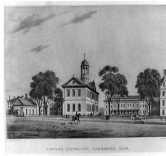
HARVARD UNIVERSITY, CAMBRIDGE, MASS.

Se fundó el " Harvard College ", en los Estados Unidos.